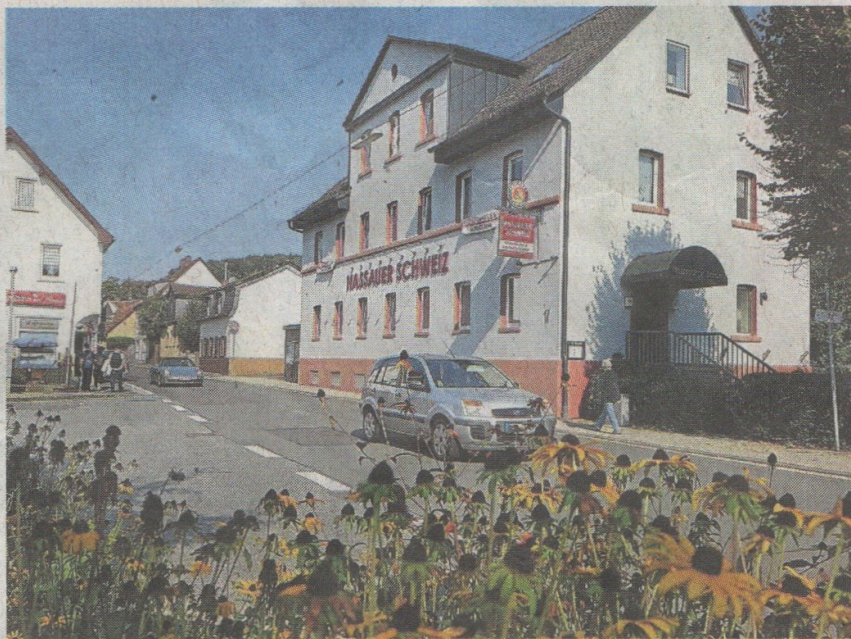
Die traditionsreiche Gastwirtschaft liegt zentral in der Hofheimer Straße.