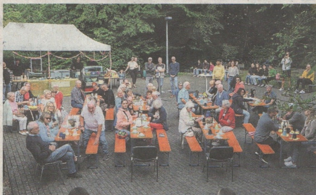
Eindruck vom Sommerfest.

Trotz aller Bemühungen ist so ein Hallenneubau eine große Sache und es sollte noch weitere 20 Jahre dauern, bis im Jahr 2000 der Antrag für den Abriss der alten Halle gestellt werden konnte, also vor 25 Jahren. In diesem Jahr fand auch der erste Duathlon in Lorsbach