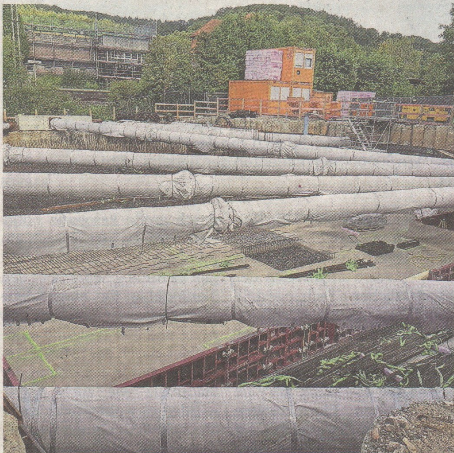
Blick in die Baugrube: Bis April soll der Erweiterungsbau der Lorsbacher Grundschule fertig sein.

Der Kran, wird in Lorsbach erzählt, habe dann doch auch nicht einfach so hingestellt werden können, wie man wohl gedacht habe. Auf Nachfrage bestätigt das Kreissprecher Johannes Latsch indirekt und lässt wissen, unter den Kranfüßen seien „kleine Bohrpfähle in den Boden eingebracht“ worden. Das diene dazu, „die Last in die tragenden tieferen Schichten abzuleiten“. Um den Untergrund zu stabilisieren, habe man insgesamt Mehrkosten von 100 000 Euro. Das sei aber „für ein solches Bauprojekt nicht ungewöhnlich“. babs