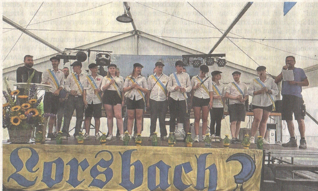
Die Lorsbacher Kerbeurschen und -mädel.