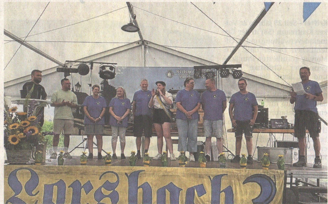
Der neue Vorstand der Kerbegesellschaft Lorsbach.

Mit dabei natürlich das treue Schlabach-Gebläse, das beim großen Einmarsch wie immer für Gänsehaut sorgte. Am Nachmittag standen die Wahl der Apfelweinkönigin