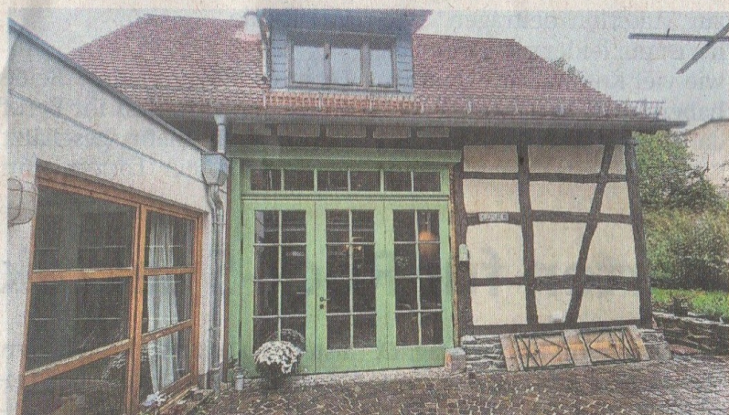
Blick auf das Gebäude aus dem 18. Jahrhundert.