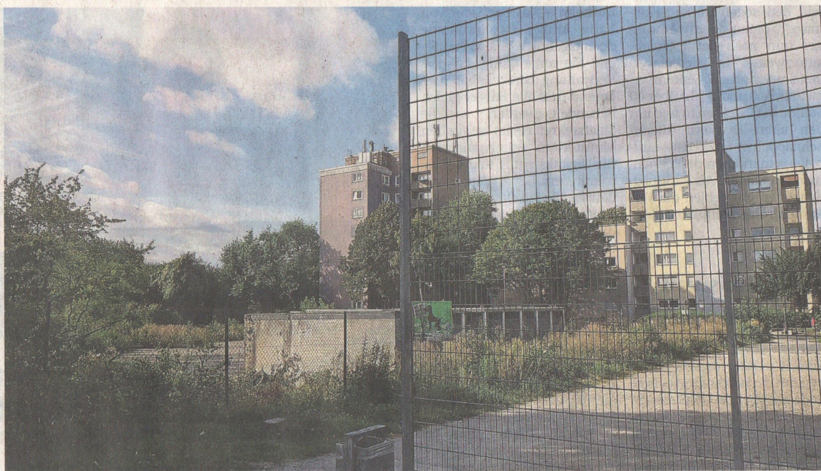
In direkter Nachbarschaft des Finanzamts wird die HWB nun bauen, der Garagenhof wird bald abgerissen.