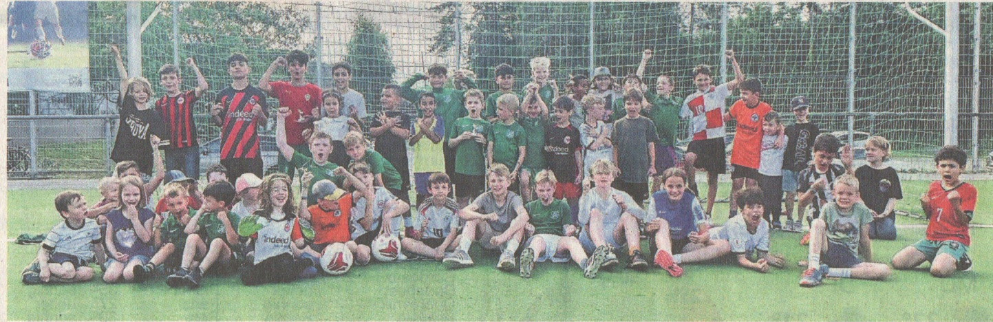
Beste Stimmung beim Saisonabschluss der Jugendabteilung des FC Lorsbach.

Im Rahmen der Festlichkeiten wurden alle Jugendspielerinnen und -spieler für ihren Einsatz, ihren Teamgeist und ihre persönliche Entwicklung mit einem Pokal ausgezeichnet. Dieser Moment des Stolzes unterstreicht die wertvolle Arbeit und das Engagement, das in die Nachwuchsförderung des Vereins gesteckt wird. Es ist schön zu sehen, wie die jungen Talente wachsen und sich weiterentwickeln – sowohl sportlich als auch persönlich.