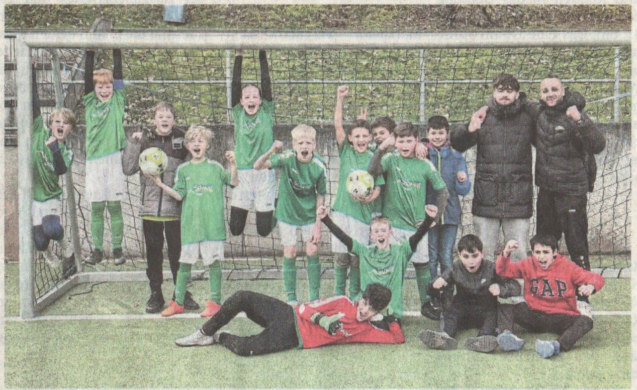
Jubel bei der E-Jugend des FC Lorsbach.