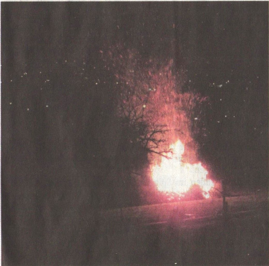
Neujahrsfeuer in Lorsbach.

Der Turm am Ringwall ist über den Alteburgweg erreichbar. Er wurde 2005 erbaut und ist ein beliebtes Ziel für Spaziergänger und Wanderer. Es gibt dort keine Parkmöglichkeiten. red