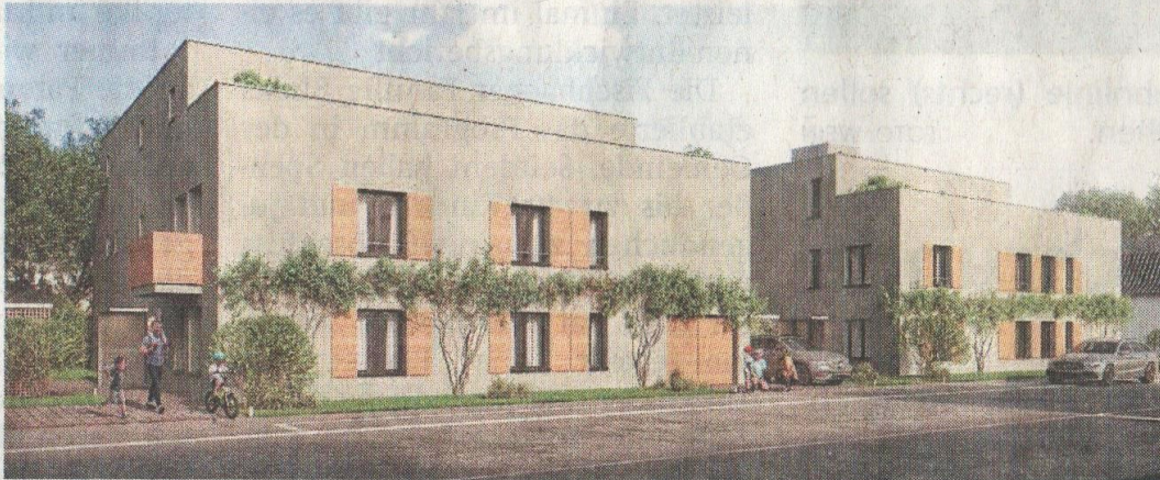
So sah die Ursprungsplanung für das Projekt in Lorsbach aus – sie wurde jetzt noch einmal modifiziert.

Angesichts dieser Pläne erübrigen sich natürlich alle Überlegungen der Linken für einen provisorischen Kindergarten an dieser Stelle – selbst wenn sich das Neubauprojekt um einige Monate verschieben würde. Die HWB hält selbst einen Kindergarten in Containerbauweise nur für sinnvoll, wenn er mindestens zehn Jahre stehen kann. Angesichts der Tatsache, dass dringend bezahlbare Wohnungen gebraucht werden, ist eine derartige Verzögerung aus Sicht des Magistrats nicht vertretbar. bt