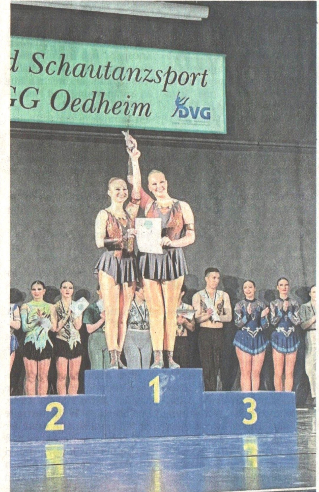
Siegerehrung der Small Group Polka Sharks.

Dieses Mal ist jedoch die Anreise nicht so lang, der TSC Ysenburg richtet am Wochenende das Ranglistenturnier in der Hugenottenhalle in Isenburg aus. Wir drücken allen Tänzern die Daumen und freuen uns, euch auf der Turnierbühne zu sehen.