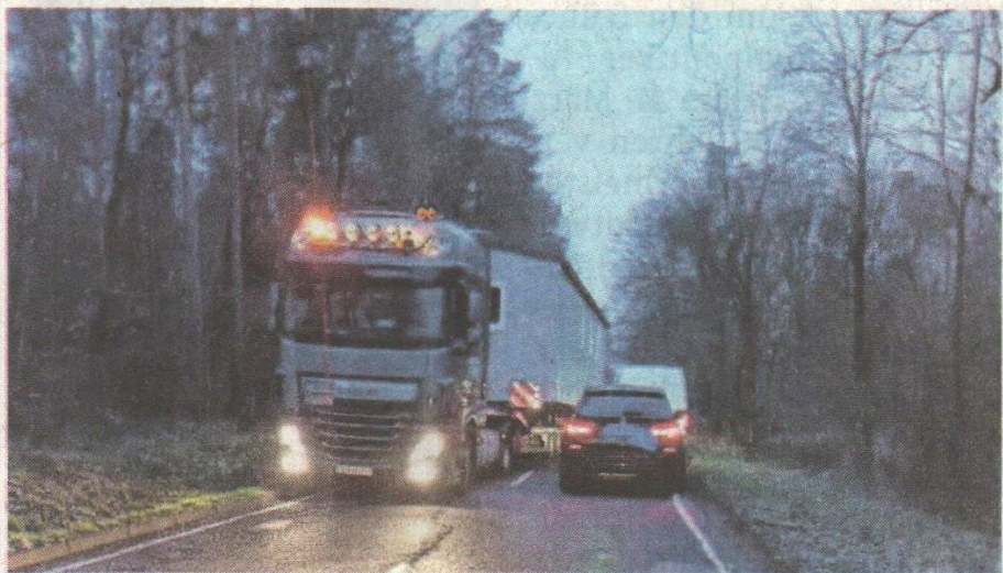
Nur mit Mühe und Not kamen die Autofahrer an dem Hindernis vorbei.

getraut und sind wieder umgedreht“, so Gerner weiter. Um 8.15 Uhr habe ein anderer Lorsbacher beobachtet, dass der überbreite Schwertransporter von mehreren Polizeistreifen zwischen Lorsbach und Eppstein gestoppt wurde. Er hat sich also rund zwei Stunden durch Alt Lorsbach gequält, Wohnhäuser beschädigt und den Verkehr massiv behindert habe. „Zum Glück konnten sich die Schulkinder und bahnfahrende Fußgänger rechtzeitig in Sicherheit bringen, so dass es nicht auch noch zu Personenschäden kam. Aber irgend-