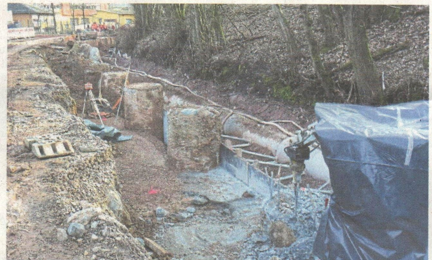
Alle 81 Bohrpfähle sind fertig, verbaut wurden dabei 900 Tonnen Beton. Sie tragen die Stützmauer, für die 1000 Tonnen Beton gebraucht werden.

Das Land jedenfalls hat in den letzten Wochen eine Kommunikationsoffensive gestartet, die im Besuch des Ministers gestern ihren Höhepunkt fand. „Eine schöne Entwicklung“, findet auch Hofheims Bürgermeister Christian Vogt (CDU). Einen sicheren Plan zur Verhinderung von Regen und Schnee in den nächsten Wochen hat allerdings auch die Stadt Hofheim nicht.