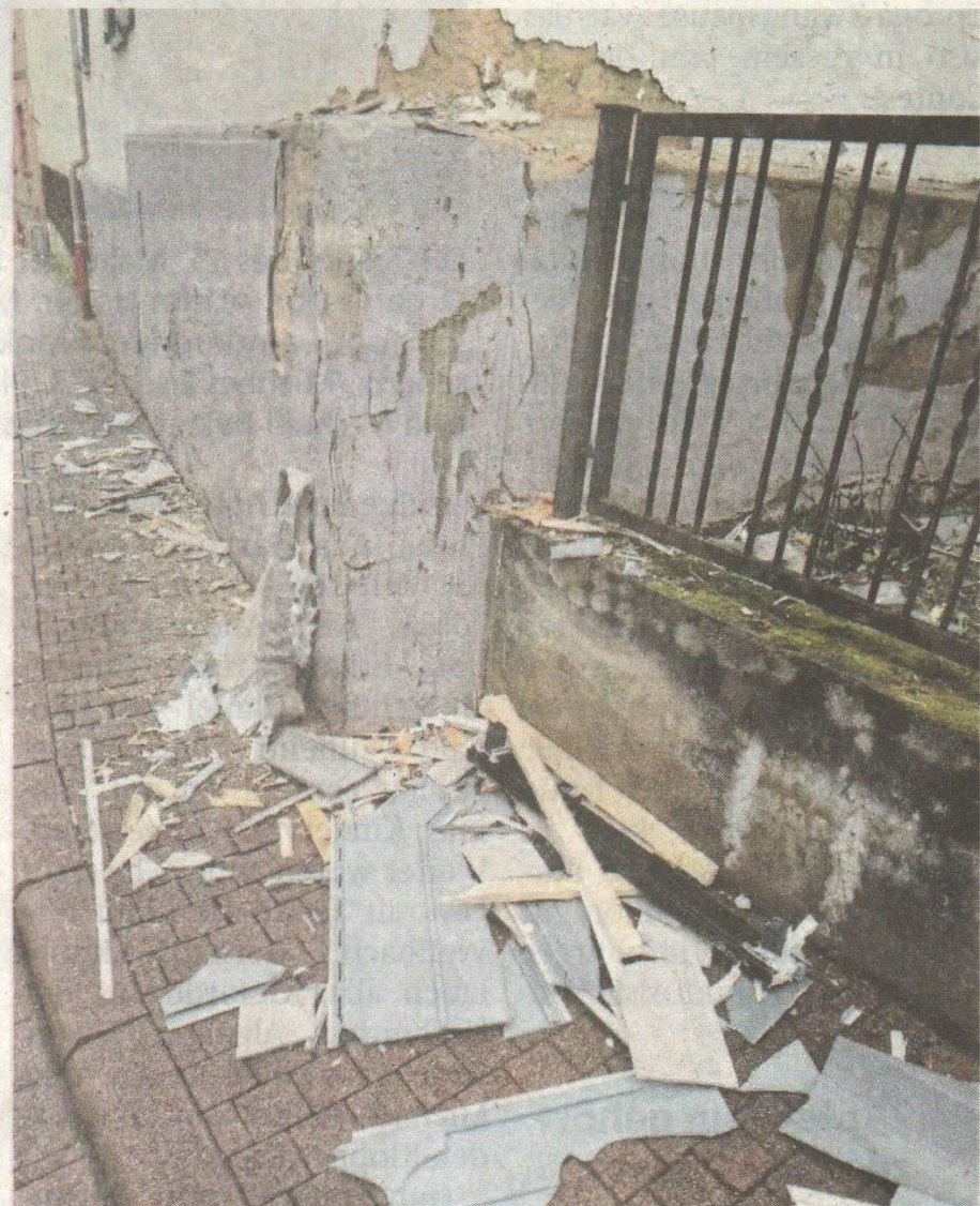
Massiver Schaden an einem Wohnhaus.

Herbst beziehungsweise Jahresende bestehen. Die Beschilderung für den Lkw-Verkehr müsse dringend verbessert und der Verkehr viel häufiger kontrolliert werden. „Wir wollen keine Schwerverletzte oder gar Tote dort beklagen. Deswegen bitten die Lorsbacher Bürger den Magistrat eindringlich dort tätig zu werden damit sich ein solches Chaos nicht wiederholt“, schreibt Gerner abschließend.