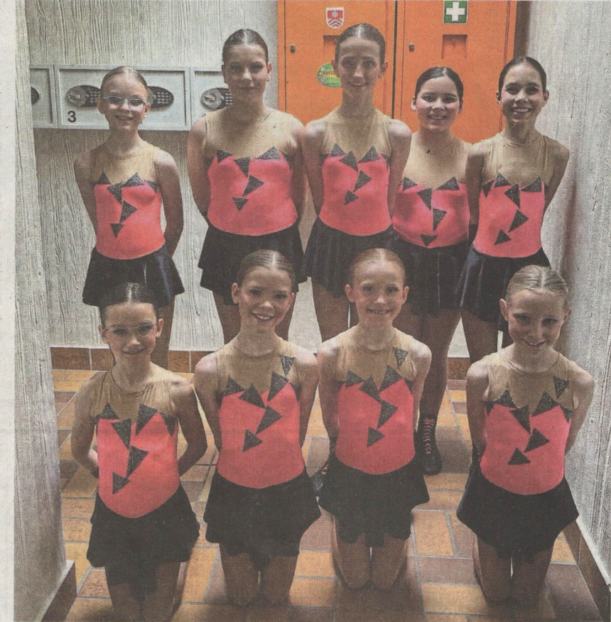
Mini Sharks Polka.

Kurz darauf ertanzte sich unsere Small Group mit ei-