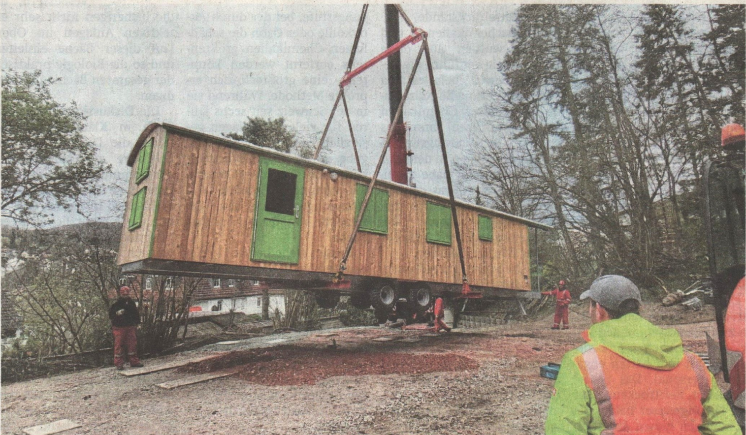
Der Bauwagen schwebt auf seinen neuen Standort ein.

Die Kinder können es bestimmt kaum erwarten, ihr neues Reich in Gebrauch zu nehmen. Lange genug haben sie und ihre Eltern darauf gewartet.