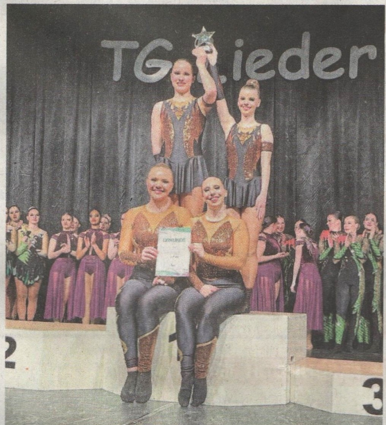
Sharks Polka und Modern.