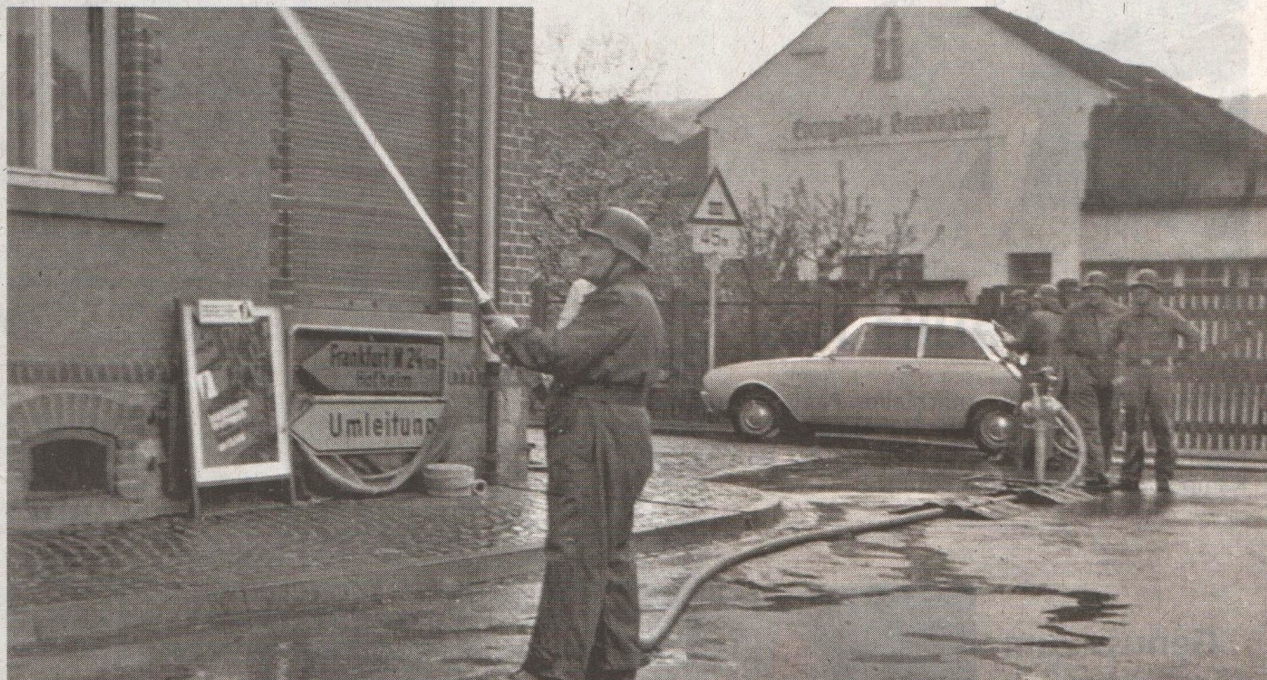
Ein Fotodokument aus den 1970er Jahren, genauer lässt sich dessen Entstehung nicht beziffern. In der Ortsmitte hielt die Feuerwehr eine Übung ab, 1980 wurde das Gebäude abgerissen.

Bleibt noch die Frage nach der Zeit zwischen der Schließung der Brotfabrik und dem Abbruch der alten Gebäude. Wann sind in der Brotfabrik die Öfen ausgegangen? Es muss vor 1932 gewesen sein, denn in diesem Jahr bekam die evangelisch-methodistische Gemeinde die Gebäude von