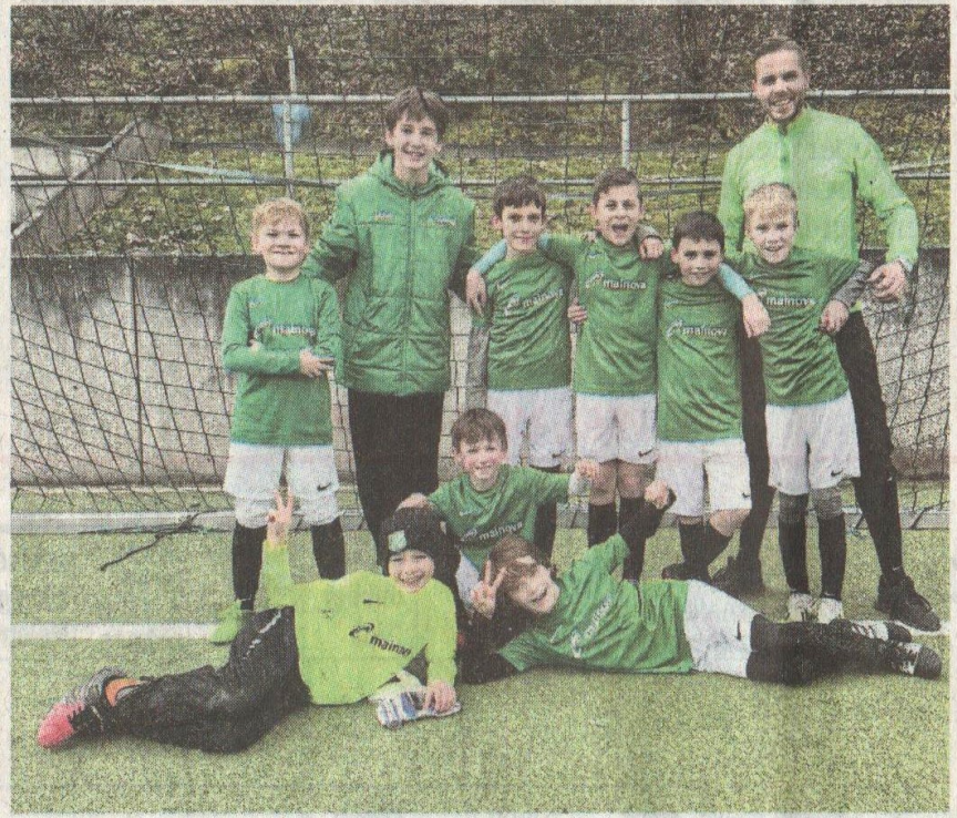
Die F1-Jugend siegte deutlich mit 12:0.

Die E-Jugend hatte am Samstag die Mannschaft von SG Bad-Soden zu Gast. Nach der ersten Halbzeit stand es noch 0:1, aber dank einiger taktischer Umstellungen der Trainer in der Halbzeit, konn-