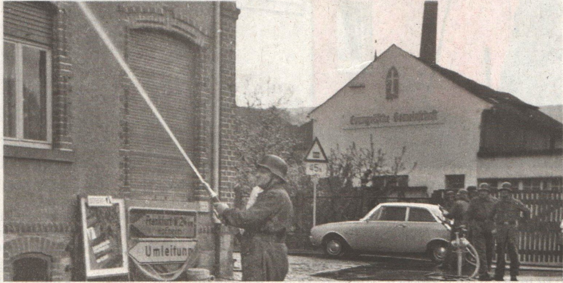
Ein Fotodokument aus den 1970er Jahren, genauer lässt sich dessen Entstehung nicht beziffern. In der Ortsmitte hielt die Feuerwehr eine Übung ab, 1980 wurde das Gebäude abgerissen.