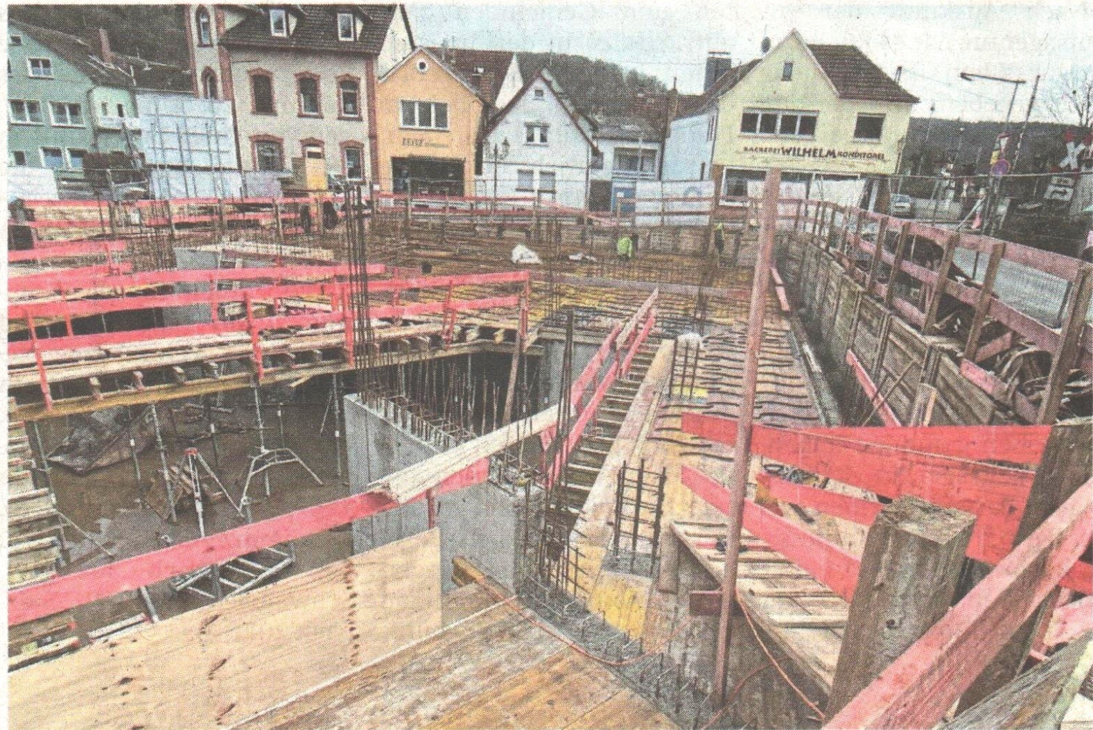
Aufnahme des Rohbaus an der Straße Alt Lorsbach.

Mit der Bodenplatte hatten die Rohbauer nun eine stabile Grundlage, um den Hochbau effizient voranzutreiben. „In den letzten Wochen wurden nahezu alle Außen- und Innenwände geschalt, bewehrt und betoniert. Mitte letzter Woche, konnte bereits der erste Teil der Deckenplatte über der künftigen Tiefgarage an der Baustelle in der Straße Alt-Lors-