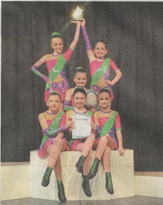
Mini Sharks Marsch.