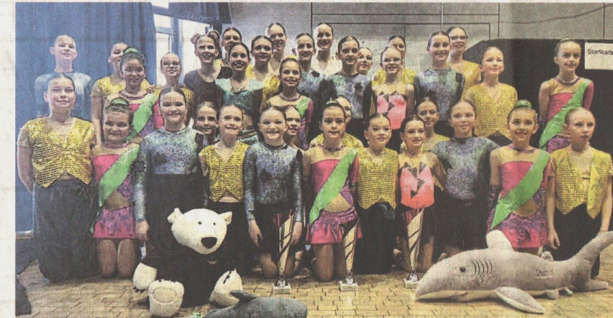
Die Schülerklasse Mini Sharks.

Am Nachmittag hieß es dann Bühne frei für die Schülerklassen Schautänze. In einem engen Starterfeld erreichte der Lorsbacher Freestyle durch einen starken Durchgang mit 236 Punkten Platz 1 in der frisch aufgestiegenen 2. Bundesliga. Den Ab-