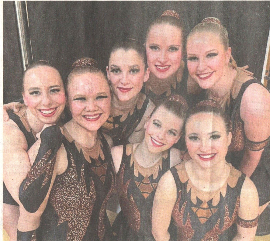
Die Mädchen von den Small Group Sharks.

Nach der ersten Siegerehrung und einer kleinen Verschnaufpause ging es weiter mit unserer Garde Small Group. Mit neuen Tänzerinnen und neuen Formationen ging es für die Mädels dieser Gruppe auf die Bühne. Die Aufregung machte es den Tänzerinnen dieser Gruppe nicht leichter und somit lief