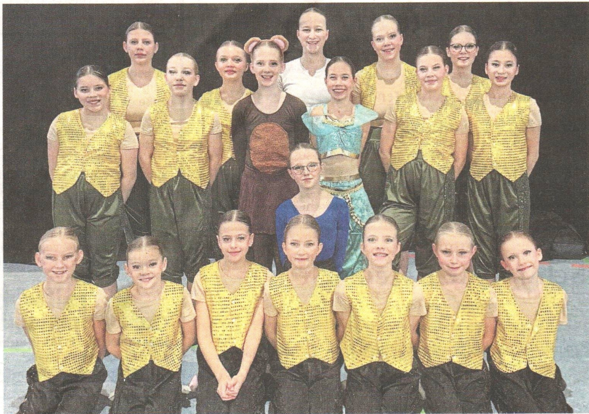
Die Schülergruppe Charaktertanz.