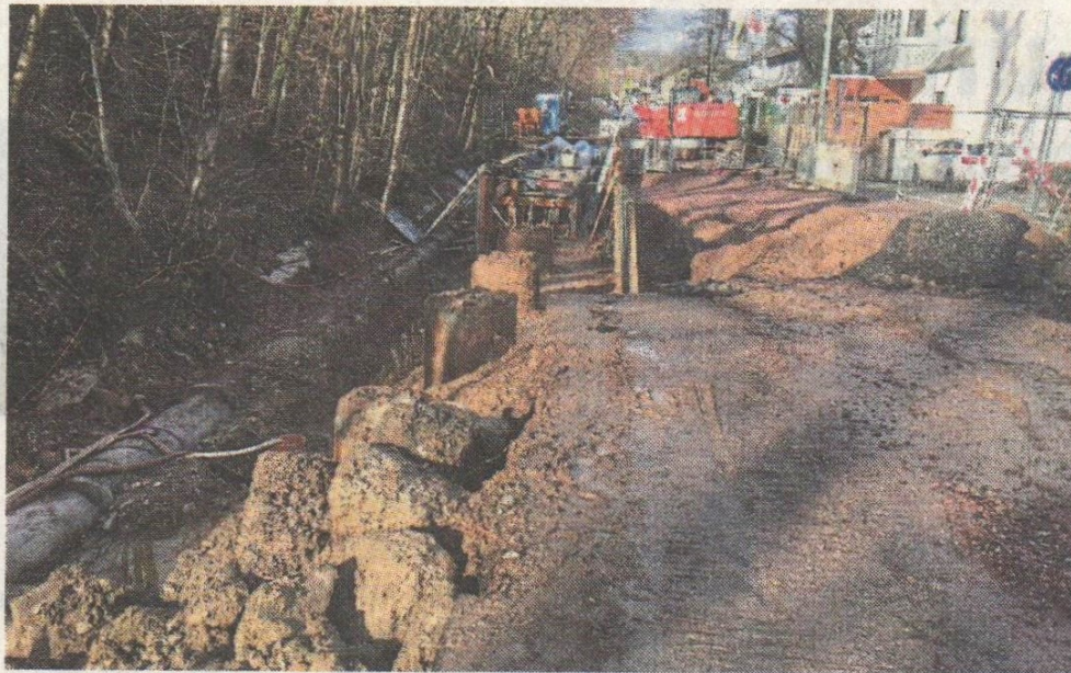
L3011-Baustelle am Lorsbacher Ortseingang.

Zum anderen hätten sich Schwierigkeiten bei der Mühlgrabenverrohrung ergeben. Das Sediment im Bachbett sei kompakt und durchdrungen von Metall, Beton und Holz gewesen, so dass man keinen Saugbagger einsetzen konnte. Statt dessen wurden diese Arbeiten mit Bagger und Handarbeit erledigt. An einigen Ta-