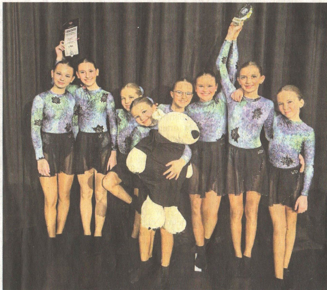
Mini Sharks Freestyle Formation Platz 1.

der 1. Bundesliga und ertanzte sich sehr gute 278 Punkte, mit denen sie sich den 5. Platz in einem sehr starken Teilnehmerfeld sicherte. Am späten Abend durften