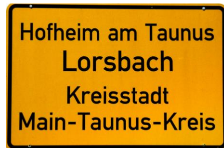
Ortseingangstafel von Lorsbach

der Name von „Lar“ abgeleitet, einer alten Bezeichnung für eine eingefriedete Weidefläche, die in mitteldeutschen Ortsnamen häufiger vorkommt. Der Name hätte sich somit aus einer Ortsbezeichnung mit der Bedeutung „Weide am Bach“ entwickelt.